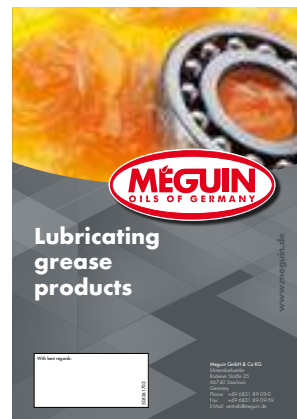
Núm. de art./Art. n.º 50536