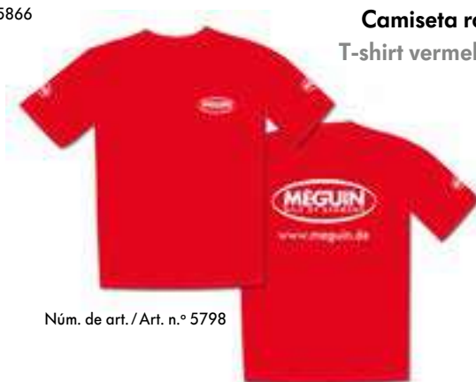
Núm. de art./ Art. n.º 5798