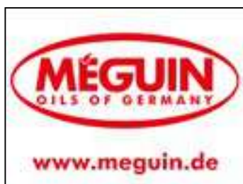
Núm. de art./ Art. n.º 5698