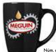
Núm. de art. / Art. n.º 5759