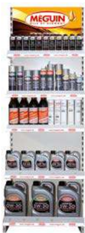
Estantería de metal TEGO 66,5 cm Estantería tego-metall 66,5 cm