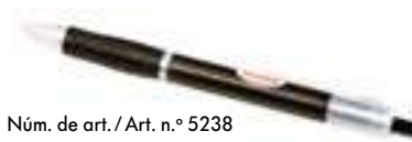
Núm. de art. / Art. n.º 5238

Banderola de escritorio Bandeira de mesa