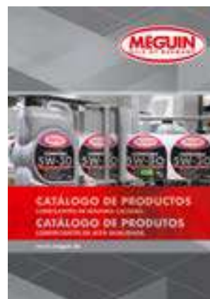
Núm. de art./Art. n.º 9381

Prospecto de aceites anticorrosivos Prospecto de óleos de proteção contra a corrosão