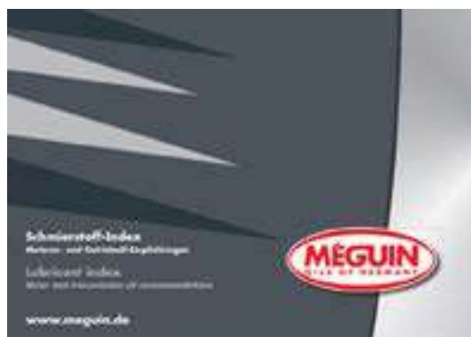
Núm. de art./Art. n.º 5363