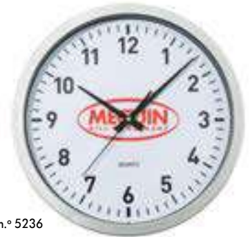
Núm. de art. / Art. n.º 5236