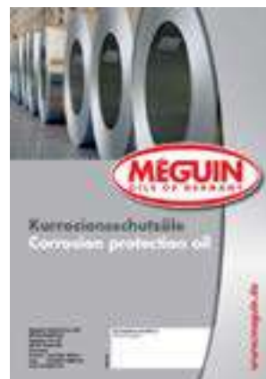
Núm. de art./Art. n.º 8582