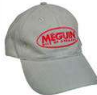
Núm. de art. / Art. n.º 5257