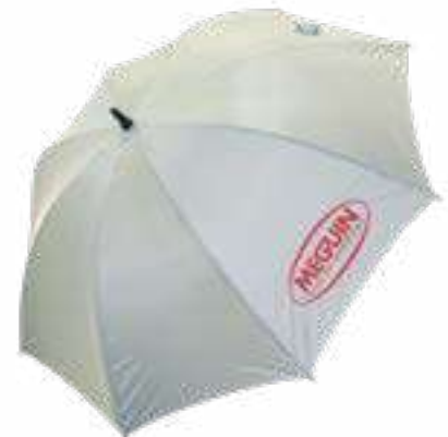
Núm. de art. / Art. n.º 5321