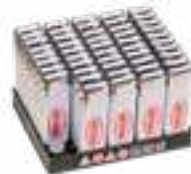
Núm. de art. / Art. n.º 5240