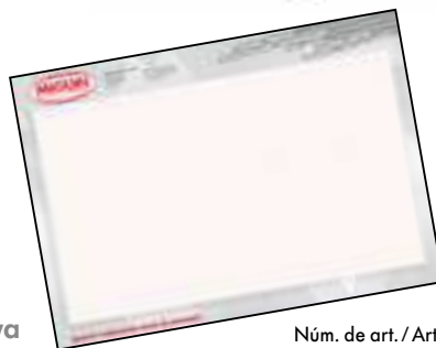
Núm. de art. / Art. n.º 5758