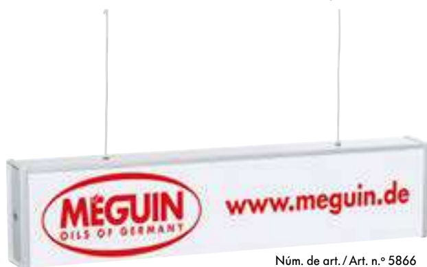
Núm. de art./ Art. n.º 5866